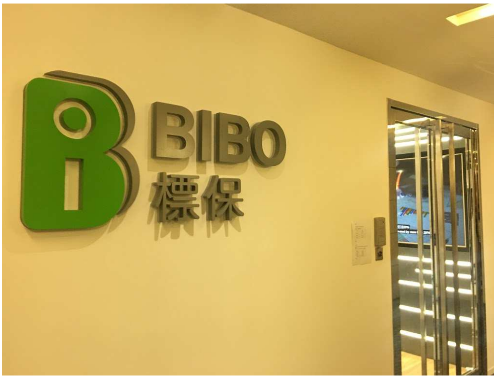
到达 BIBO 公司