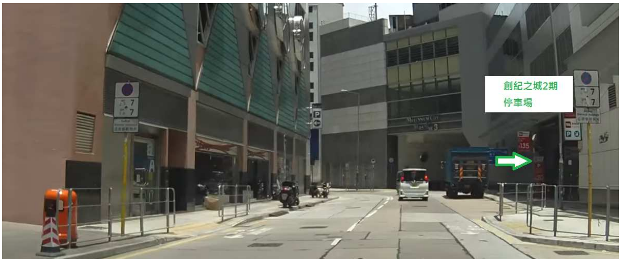
右手面是创纪之城 2 期停车场