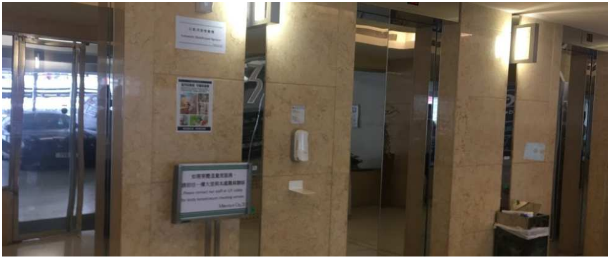
搭升降机往 21 楼