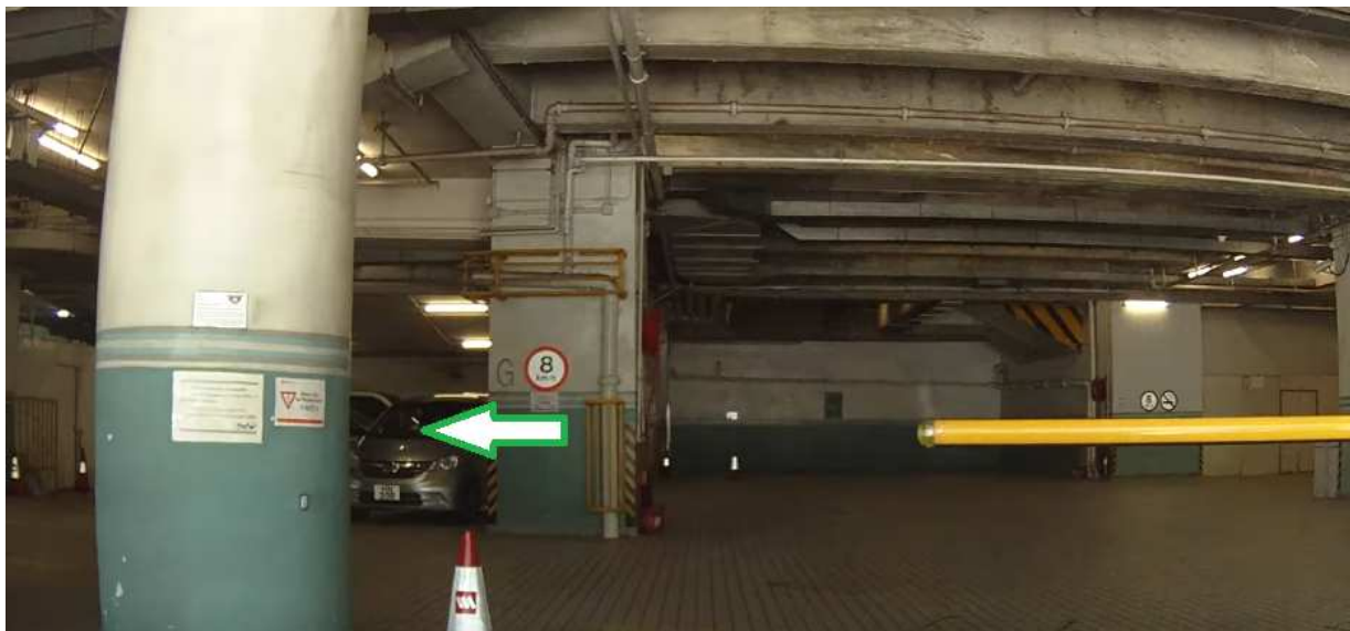
创纪之城 2 期停车场闸口，进入后转左