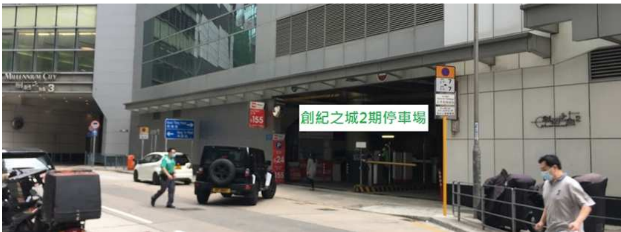
驶入创纪之城 2 期停车场