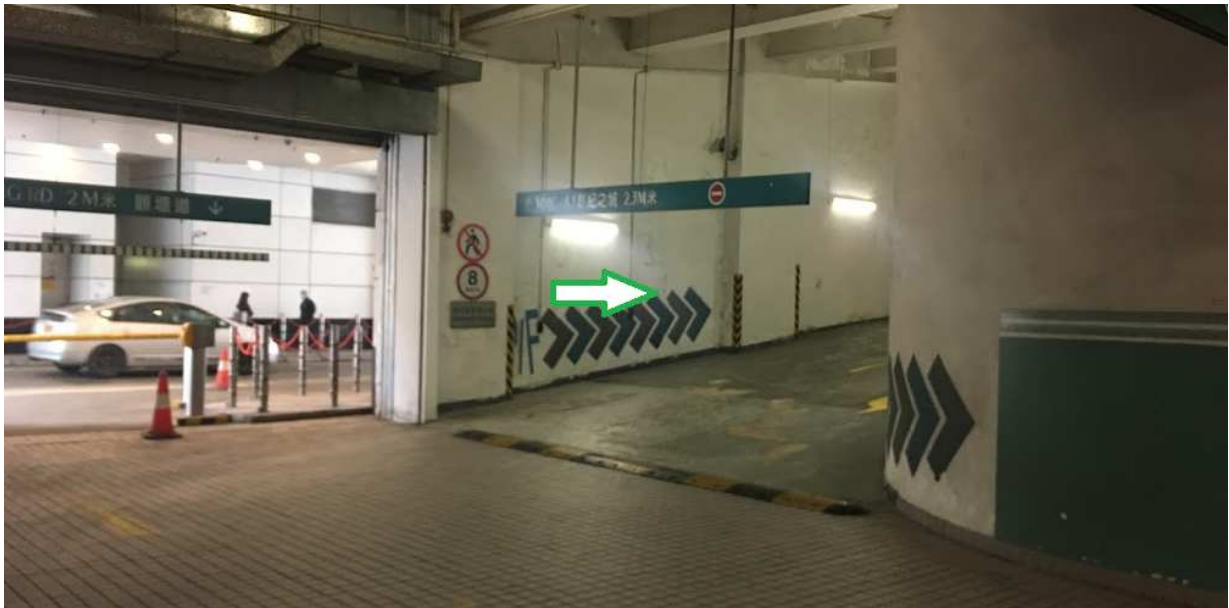
转右驶上 3 楼停车场