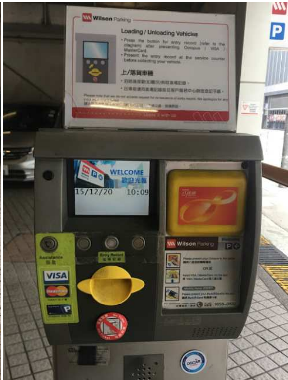
创纪之城 2 期停车场闸口 - 停车场收费表，使用八达通 私家车时租 HK$24